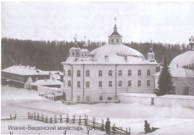
Иоанно-Введенский монастырь. Начало XX века

была обнаружена в Государственном архиве города Тобольска при изучении ряда документов, связанных с историей семьи Дружининых. Однако дело осложнялось тем, что сведения о семье, опубликованные в епархиальной прессе более 120 лет назад и задающие первичный вектор поиска, не полны, а порою и в корне не верны.