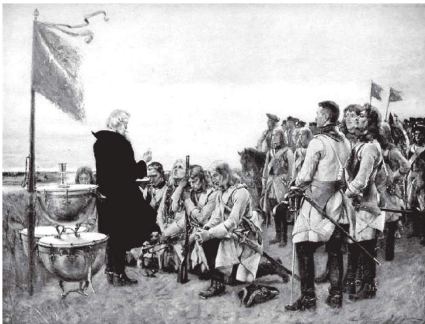
1. Густав Сёдерстрём. Причастие в шведских войсках. XIX в.

Многочисленная – около тысячи человек, тобольская колония пленных офицеров, их жен, детей и слуг постаралась, насколько это было возможно, создать привычный культурный ландшафт и комфортный образ жизни. Прежде всего была налажена религиозная жизнь офицеров-лютеран. Находясь в православной столице Сибири, шведы старались сохранить свою религиозную традицию. Первые два года привычные к полевым условиям военные проводили службу прямо под открытым небом, вероятно, все-таки надеясь, что они не-